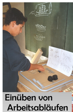
Einüben von Arbeitsabläufen